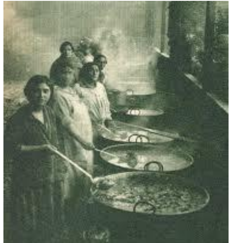
“Olla común” organizada por mujeres obreras en Chile, a inicios de la década de 1930