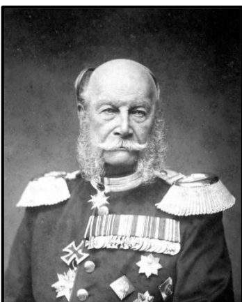
EL KÁISER GUILLERMO I.