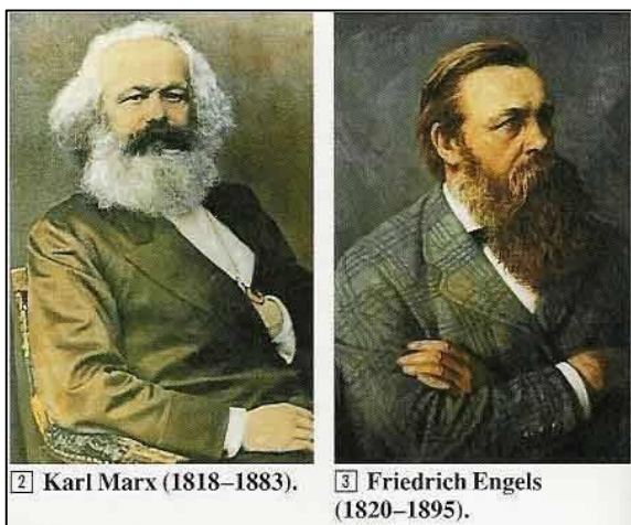
2 Karl Marx (1818–1883).

II.- Posteriormente, en 1848 una obra escrita de carácter ideológico convulsionó el panorama de las ideas políticas: se llamaba el Manifiesto Comunista . Sus autores fueron Karl Marx y Friedrich Engels, y plantearon en ella los fundamentos del llamado Socialismo Científico o Marxismo . Propusieron una explicación global y real del problema de los trabajadores (de ahí el nombre de científico) en la Historia, afirmando que la Humanidad siempre había vivido en una “lucha de clases” , es decir, el enfrentamiento entre “explotadores” (una minoría) y “explotados” (la mayoría). En la antigüedad, hombres libres frente a los esclavos, en Roma los patricios versus los plebeyos, en la Edad Media la nobleza feudal sobre los vasallos. Así, a partir de la Revolución Industrial, esta lucha surgirá entre la burguesía y el proletariado , es decir, los trabajadores. Los dueños del capital (dinero), es decir los burgueses, buscarían siempre maximizar sus ganancias con cargo a una mayor explotación de los obreros, que solo dependerán de su trabajo para vivir. Los burgueses buscaban acumular su capital mediante la diferencia entre lo que ganaban los obreros y la ganancia por los productos fabricados, diferencia que Marx llamó “plusvalía” . Para obtener mayor plusvalía entonces, la ganancia capitalista debería ser a base de bajos sueldos de los trabajadores.