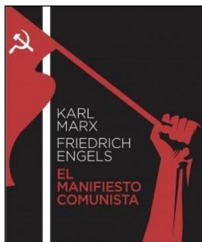
3 Friedrich Engels (1820–1895).

Marx sostuvo entonces que era fundamental que los obreros tomaran consciencia de su situación , que salieran del estado de “alienación” en el que vivían y se sintieran unidos como una sola clase social. Luego de esto, debían iniciar la organización y movilización proletaria (unión de sindicatos, partidos políticos obreros), para resistirse a la explotación y lograr tomarse el poder a través de una revolución . Al tomarse el poder por la vía revolucionaria o violenta, los obreros crearían un gobierno transitorio, la llamada “dictadura del proletariado” , y comenzarían a tomar las primeras medidas, por ejemplo, pasar a manos del Estado (estatizar o socializar) los grandes medios de producción (fábricas, campos, bancos).