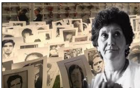
A la izquierda, Sola Sierra, Presidenta de la AFDD entre 1977 y 1999; A la derecha, mujeres protestan con carteles de sus familiares Detenidos Desaparecidos.

A su vez, los familiares de las víctimas de represión crearon diversas organizaciones: las primeras de ellas fueron la Agrupación de Familiares de Detenidos y Desaparecidos (AFDD, 1974) y la Agrupación de Familiares de Presos Políticos (AFPP, 1976) . La AFDD se ganó un rápido reconocimiento internacional, y entre 1977 y 1980 realizó varias huelgas de hambre como forma de presionar al Régimen para que se esclareciera la situación de sus familiares desaparecidos.