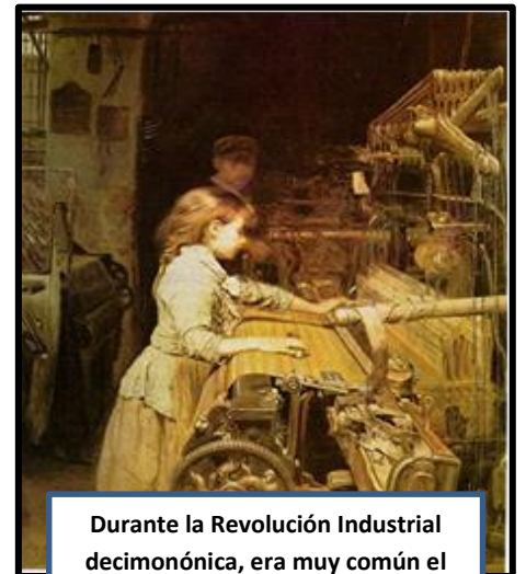
Durante la Revolución Industrial decimonónica, era muy común el trabajo infantil en las fábricas.

En relación a esto, es importante centrarnos en el concepto de la Cuestión Social . La Cuestión Social es una expresión acuñada en Europa a inicios del siglo XIX que intentó recoger las inquietudes de políticos, intelectuales y religiosos frente a una serie de problemas, entre ellos la pobreza y mala calidad de vida de la clase trabajadora , generados después de la Revolución Industrial,