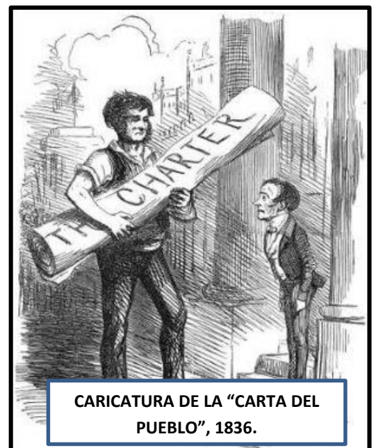
CARICATURA DE LA “CARTA DEL PUEBLO”, 1836.

Ante esta situación laboral (y de vida), muchos trabajadores empezaron paulatinamente a organizarse para exigir mejoras en la calidad laboral. Así surgieron los primeros sindicatos , es decir, una asociación integrada por trabajadores en defensa y promoción de sus intereses laborales, ante el empleador con el que están relacionados. Los primeros sindicatos de trabajadores surgieron en Inglaterra, y luego se extendieron a otros países de Europa occidental y a EEUU más tarde. Un antecedente del fenómeno del sindicalismo , fue un movimiento popular radical que surgió en el Reino Unido en 1836 y que expresaba la agitación de la clase obrera, debido a los cambios derivados de la Revolución Industrial, y que recibió el nombre de Cartismo . ¿Por qué se llamaba así? Porque en el año 1836, la Asociación de Trabajadores de Londres (primera organización que intentó agrupar a trabajadores de distintos gremios 2 con la finalidad de unir lo gremial y lo político) escribió un documento denominado la “ Carta del Pueblo ” que enviaron al Parlamento Británico exigiendo una serie de peticiones, entre ellas, la participación obrera en el Parlamento. No consiguieron todo lo que querían, pero sentaron las bases del futuro movimiento sindical británico, y que posteriormente, se extendería por el resto de Europa.