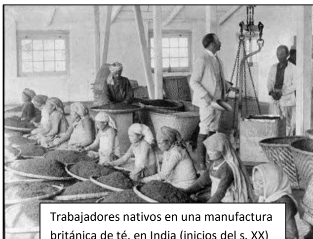
Trabajadores nativos en una manufactura británica de té, en India (inicios del s. XX)

1) El desarrollo de la industria europea y su necesidad de hallar nuevos mercados y materias primas. En efecto, el desarrollo de la segunda revolución industrial (a partir de 1870) impulsó a los países más industrializados a buscar nuevos mercados donde situar los excedentes de su producción y, también, lugares donde obtener materias primas (algodón, hierro, carbón, lino, caucho, etc.) al mejor precio posible. A su vez, las colonias eran un lugar donde se podían invertir los capitales excedentes de la producción industrial y, mediante un monopolio, asegurarse el control comercial con ellas.