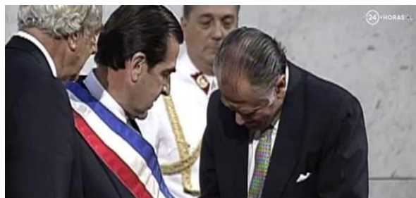
El Presidente saliente, Aylwin, coloca la banda presidencial en el traspaso de mando al nuevo Presidente, Eduardo Frei. Marzo de 1994.

De esta forma, resultaba electo Presidente Eduardo Frei Ruiz Tagle para el sexenio 1994-2000, dando continuidad a los gobiernos de la Concertación (en marzo de 1994 se realizó una reforma constitucional, dejando en 6 años el período presidencial)