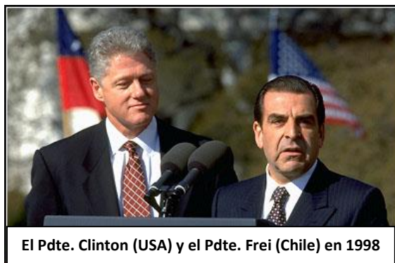
El Pdte. Clinton (USA) y el Pdte. Frei (Chile) en 1998

Buscando la consolidación de la economía de Chile y su inserción en el mundo, el gobierno del Presidente Frei se dedicó a buscar nuevos socios comerciales: con los países integrantes del NAFTA o Tratado de Libre Comercio de América del Norte, firmó tratados de libre comercio con Canadá (1996) y México (1998); en 1996, Chile suscribió un convenio en calidad de miembro asociado con el Mercado Común del Sur (Mercosur) así como un acuerdo marco para asociarse con la Unión Europea (en enero 1999). Además, pasó a integrar el Foro de Cooperación Económica del Asia Pacífico (APEC) e ingresó a la Organización Mundial de Comercio (OMC) . También, en 1999 se firmó tratados con Centroamérica.