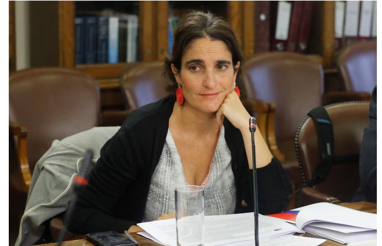
Ministra Ma. José Zaldivar

La Dirección del Trabajo es un Servicio Público descentralizado, con personalidad jurídica y patrimonio propio. Está sometido a la supervigilancia del Presidente de la República a través del Ministerio del Trabajo y Previsión Social, y se rige por su Ley Orgánica (D.F.L. N° 2, del 30 de mayo de 1967) y el D.L. N° 3.501 de 1981