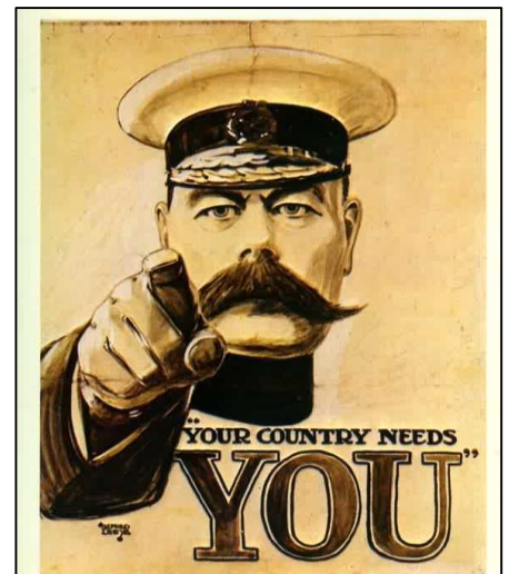
Cartel de reclutamiento británico durante la Primera Guerra Mundial

En cuanto a la población, los Aliados (Entente) contaban con 255 millones de habitantes, mientras los Imperios Centrales sólo cerca de 120 millones. Respecto a las fuerzas militares de tierra estaban mucho más equilibrados, sin embargo, en el mar la superioridad estaba indiscutiblemente en manos de la Entente (especialmente gracias a la Royal Navy inglesa), y los alemanes intentarán compensar esto con la estrategia de guerra submarina. Finalmente, desde el aspecto estratégico , los Imperios Centrales formaron un bloque compacto mientras que los países de la Triple Entente fueron territorios más dispersos, pues no había conexión entre Rusia y los demás países. El único problema era que Alemania tenía que luchar en su temida “guerra de dos frentes”: al Este contra Rusia, y al Oeste contra las fuerzas anglo-francesas.