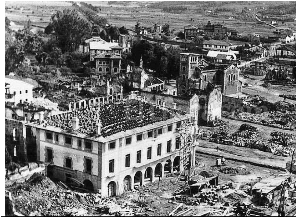
Arriba, la ciudad de Guernica (norte de España), arrasada por la aviación alemana en 1937

De esta forma la Guerra Civil Española se transformará en un conflicto ideológico internacional entre los fascistas y los comunistas, donde los tres líderes de los distintos regímenes totalitarios se encuentren en este escenario que cambiará para siempre el concepto de Guerra, siendo la Guerra Civil una guerra ideológicamente “justa” y una guerra de “Guerrillas” porque lucharán en cada ciudad y pueblo como una antesala de la II Guerra Mundial.