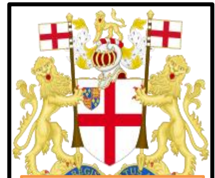
Escudo de la Compañía de las Indias Orientales.

Otras áreas de dominio británico en Asia fueron Malaca (Malasia) y Singapur ; ésta se convirtió en un punto estratégico en las rutas marítimas. Birmania , que había constituido un protectorado semiindependiente fue anexionada en 1885, lo que supuso la creación de una vía terrestre hacia China.