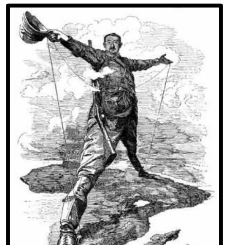
Cecil Rhodes, uno de los mayores exponentes del Imperialismo Británico.

- África: En África avanzó desde el sur (El Cabo, capital de Sudáfrica) intentando enlazar con el Sudán . Cecil Rhodes , uno de los principales exponentes del Imperialismo británico, se anexionó los territorios que llevan su nombre (Rodesia), hoy repartidos entre Zimbabwe y Zambia . En esta progresión hacia el norte chocará con los bóers , pobladores de origen holandés establecidos en Transvaal y Orange así como con la población zulú a la que venció en 1879. Con esta conquista impidió que Portugal pudiera progresar de Oeste a Este y unir sus colonias de Angola y Mozambique. Esta expansión se completó con la incorporación de Nigeria , parte de Somalia (1884), Kenia y Uganda .