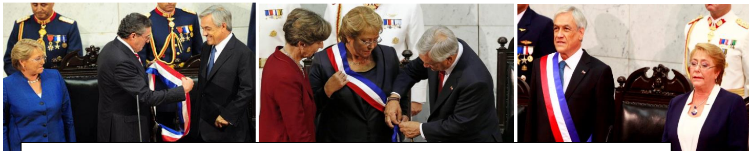
Cambio de mando presidencial: 2010 , de Bachelet a Piñera; 2014 , de Piñera a Bachelet; 2018 , de Bachelet a Piñera

Cabe señalar que, durante los 14 años de gobiernos alternados de Bachelet y Piñera, si surgieron algunos liderazgos alternativos, algunos mediáticos u otros más permanentes, que tuvieron cierto arrastre popular (Marco Enríquez Ominami en 2009, Franco Parisi en 2013, Beatriz Sánchez en 2017), pero la hegemonía política de la ex Presidenta y el actual mandatario terminaron imponiéndose.