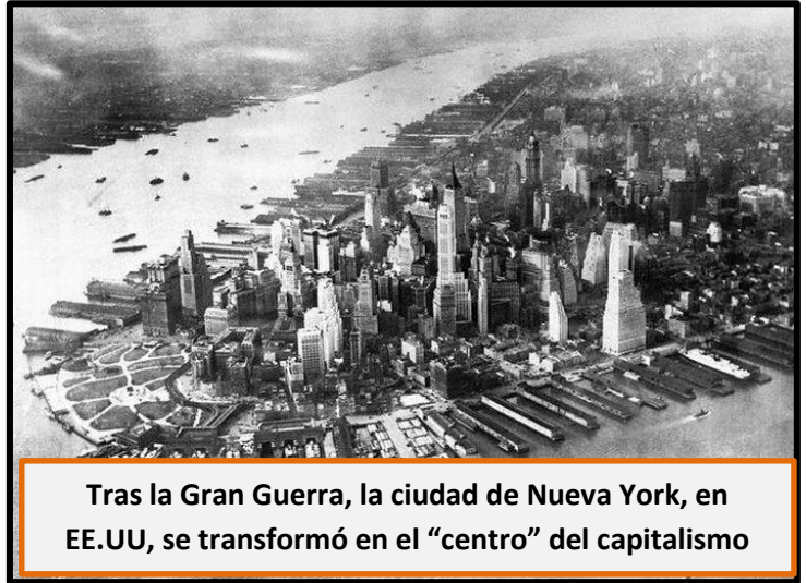
Tras la Gran Guerra, la ciudad de Nueva York, en EE.UU, se transformó en el "centro" del capitalismo

Al término de la guerra fue necesario reconvertir las industrias que habían estado destinadas durante años a la producción de guerra. El proceso fue lento y se vio entorpecido por una crisis que se alargó hasta mediados de la década de 1920. Además, el gasto bélico se financió en parte acudiendo a las reservas de oro y al endeudamiento, por ejemplo con créditos exteriores, especialmente de origen estadounidense. Se recurrió a la fabricación del papel moneda, lo que provocó una fuerte inflación, agravada en la posguerra por el desequilibrio entre demanda y producción.