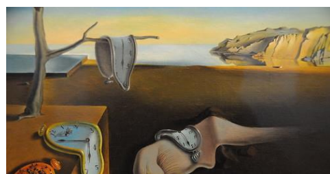
“La persistencia de la memoria”, obra surrealista del pintor Salvador Dalí.

Además, la pérdida de valores humanistas se reflejó en el arte, la literatura y la música y sirvió de empuje a movimientos como el expresionismo y el surrealismo .