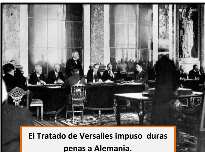
El Tratado de Versalles impuso duras penas a Alemania.

En el ámbito político, dentro de Europa comenzó una fuerte crítica al sistema democrático , pues la sociedad no se sentía representada (especialmente las clases obreras, debido al voto censitario 1 ) y porque no logró evitar el desastre que trajo la guerra. En muchos países el nacionalismo comenzó a crecer, volviéndose cada vez más agresivo, y en otros se derrumbó la forma de gobierno que tenían antes de la guerra (como en Rusia debido a la Revolución de 1917, que reemplazó a la monarquía del Zar por un gobierno marxista).