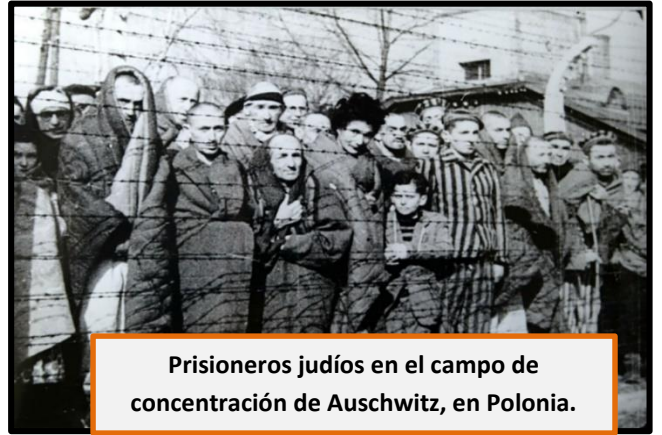
Prisioneros judíos en el campo de concentración de Auschwitz, en Polonia.

A lo largo de los cinco años que permaneció abierto (entre 1940 y 1945), más de 1.300.000 personas fueron enviadas allí, muriendo el 90% de ellas. En él, los judíos y otras personas, tenían que trabajar de sol a sol, en pésimas condiciones de higiene y salubridad. En caso de no obedecer las instrucciones de los dirigentes nazis o de los guardias, eran castigados. Mujeres, niños y hombres, ancianos o jóvenes, pasaron por este lugar. Pero sin duda, lo más terrible de la situación, fue el hecho de que millones de personas se enviaron a las cámaras de gas y fallecieron en condiciones infrahumanas. Auschwitz fue liberado una vez que tuvo lugar la rendición alemana en 1945. En 1979 fue declarado como patrimonio de la humanidad.