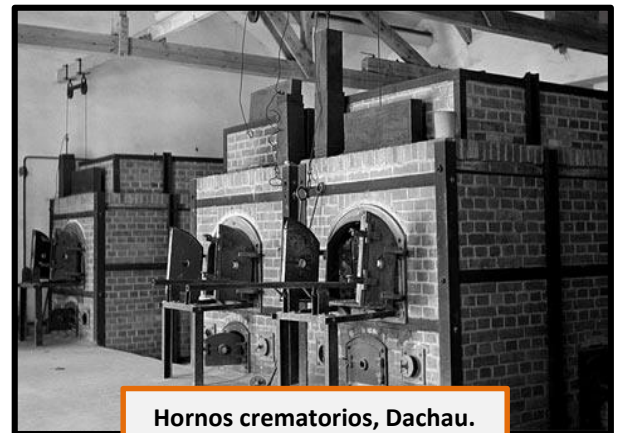
Hornos crematorios, Dachau.

Pero la situación se radicalizaría aún más durante el periodo de la Segunda Guerra Mundial. Se iniciaría el Holocausto , es decir, acciones encaminadas por parte del Régimen Nazi a exterminar de forma definitiva a los judíos. Así, la Gestapo y otras estructuras policíacas nazis se dedicaron a la persecución y detención de judíos. En efecto, la situación se radicalizó después de la invasión a Polonia. En 1942 se realizó la Conferencia de Wannsee , donde los principales líderes nazis decidieron ejecutar la "solución final": la construcción de campos de concentración y exterminio dedicados exclusivamente al asesinato de millones de personas por medio de las cámaras de gas.