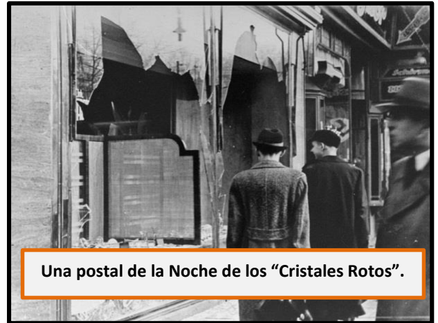
Una postal de la Noche de los "Cristales Rotos".

Así, durante la década de 1930 se pusieron en práctica en Alemania una serie de políticas antisemitas (es decir, que atentaban contra los derechos de los judíos) y contra otros grupos sociales, como los expuestos anteriormente. Uno de los primeros ejemplos de dicha práctica antisemita fueron las Leyes de Núremberg de 1935. El autor intelectual de estas leyes fue el jurista alemán Wilhelm Frick . Entre otras cosas, dicha legislación revocaba la ciudadanía alemana a los judíos, no se permitía el matrimonio entre judíos y alemanes, y el Estado Alemán se apropiaba de las propiedades y riquezas de los judíos.