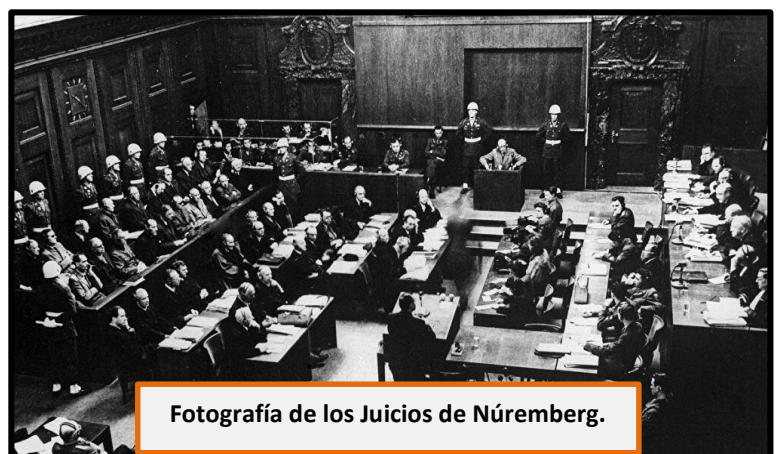
Fotografía de los Juicios de Núremberg.

Tras la victoria aliada en la Segunda Guerra Mundial, se produjo la libertad de muchos prisioneros de guerra y también de muchas personas que habían sido relegadas a los campos de exterminio nazi, como fue el caso de la liberación de Auschwitz en 1945. Tras ese proceso, se generaron también una serie de instancias que buscaron hacer justicia. Un ejemplo de eso lo ofrecen los Juicios de Núremberg , que fueron un conjunto de procesos jurisdiccionales en los que se