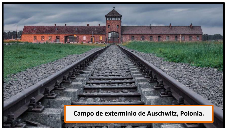
Campo de exterminio de Auschwitz, Polonia.

Posteriormente, surgieron otros campos de concentración y exterminio, esta vez, fuera de Alemania. En Polonia se ubicó, sin duda, el campo de exterminio más famoso y más popular que se conozca: el de Auschwitz . Fue el campo de concentración con mayor concentración de judíos. Tenía capacidad para 400.000 prisioneros.