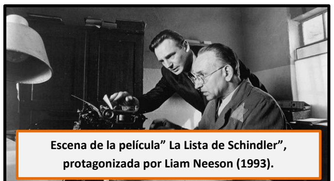
Escena de la película “La Lista de Schindler”, protagonizada por Liam Neeson (1993).

Además, el tema del holocausto ha sido ampliamente tratado en la industria cinematográfica . Muchas películas dan cuenta de este episodio tan dramático para muchas personas. Algunos ejemplos lo ofrecen “ La lista de Schindler ”; “ El niño con el pijama de rayas ”; “ La vida es bella ”; “ El pianista ”... ¿has visto alguna de ellas? Si no es así, y te interesa este tema, te invitamos a verlas.