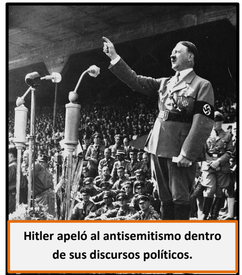
Hitler apeló al antisemitismo dentro de sus discursos políticos.

El ascenso de Hitler al poder en Alemania a partir de 1933 significó no sólo la instalación de un nuevo tipo de gobierno en Alemania, y que se proyectaría durante la Segunda Guerra Mundial. Significó también la instauración paulatina de políticas destinadas a exterminar a ciertos grupos que eran considerados peligrosos para la “raza aria”, según el discurso del gobierno germano. De esa forma, judíos, minorías sexuales y étnicas fueron perseguidas y condenadas a morir por parte del régimen nazi en el periodo de entreguerras y a lo largo de la Segunda Guerra Mundial. La literatura, e incluso el cine, han abordado esta temática que sin duda ha sido un triste episodio en la historia europea de las últimas décadas. En la presente guía se pretende analizar las principales características del Holocausto judío y del exterminio de otros grupos sociales.