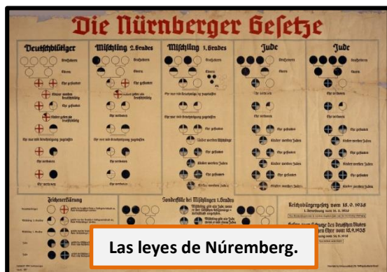
Las leyes de Núremberg.

Desde el ascenso de Hitler como Canciller de Alemania en enero de 1933, se instaló en el discurso del nuevo líder y de los altos dirigentes del Partido Nazi una serie de ideas que apelaban a la superioridad de la raza aria . Ésta, estaba llamada a dominar no sólo Europa, sino que todo el mundo, y para lograrlo, tenía que en gran medida eliminar aquellos elementos considerados nocivos o peligrosos para la Alemania que se quería construir. El darwinismo social , como teoría social evolutiva y que estaba fuertemente difundido en países como Alemania o Austria, proponía la existencia de razas humanas superiores y razas humanas inferiores . Hitler, como sabemos, se acercó a estas ideas en sus años en Viena, y encontró cabida en una Alemania que se encontraba bastante desmoralizada en el periodo de entreguerras.