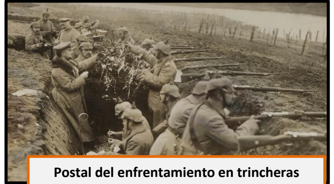
Postal del enfrentamiento en trincheras

El fracaso del Plan Schlieffen detuvo a los alemanes y el Frente Occidental se estabilizó en una cruenta guerra de trincheras 1 , donde se puso a prueba el aguante y el sufrimiento de los soldados. Es una guerra de desgaste basada más en la capacidad de abastecimiento de los frentes (hombres, recursos militares, alimentos) que en los avances militares.