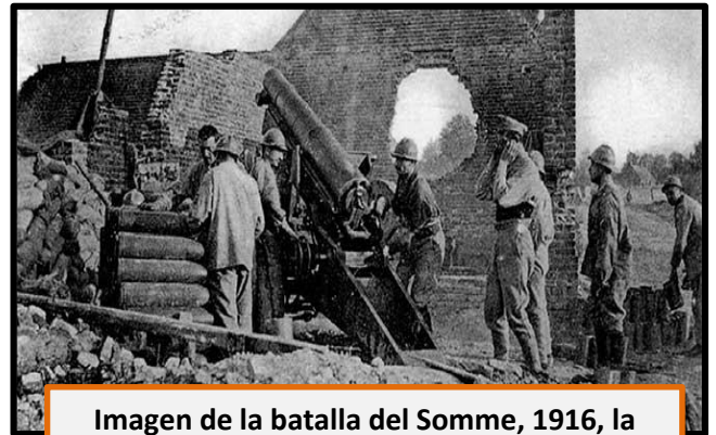
Imagen de la batalla del Somme, 1916, la más mortífera del conflicto

Con el fin de distraer la acción de los alemanes, las fuerzas británicas y francesas iniciaron una ofensiva en el norte de Francia, en torno al río Somme, dando inicio a la batalla del Somme , entre fuerzas anglo-francesas y alemanes. Las bajas fueron de nuevo descomunales, superiores a las de Verdún (1.100.000 bajas); tan solo durante el primer día de la batalla (1 de julio de 1916) los británicos perdieron cerca de 60.000 hombres. Joffre fue sustituido en el mando por el general Nivelle , en el mando francés.