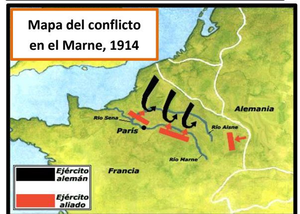
Mapa del conflicto en el Marne, 1914

En síntesis , la primera etapa de la guerra en el frente occidental se destacó, en esencia, por el avance alemán en tierras francesas con la intención de llegar a París. En el río Marne , cerca de la capital francesa, los galos detuvieron a los alemanes.