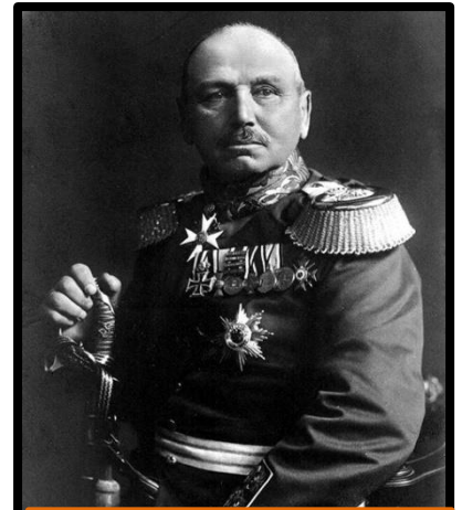
General Alexander Von Kluck, quien implementó el Plan Schlieffen

El Plan Shlieffen pareció tener éxito, pues una vez eliminada la oposición de los franco-británicos en Charleroi (Bélgica), los alemanes emprendieron un rápido avance por territorio francés sin encontrar apenas una resistencia organizada. El gobierno francés hubo de abandonar París y se retiró a Burdeos (sur de Francia)