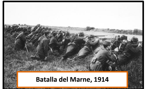
Batalla del Marne, 1914

Los franceses, comandados por el general Joffre , reorganizaron sus ejércitos aprovechando el traslado de tropas alemanas al frente oriental. Pasaron a la ofensiva en día 5 de septiembre, fecha de inicio de la batalla del río Marne donde sorprendieron a los desprevenidos alemanes que hubieron de emprender la retirada, aunque más tarde lograron estabilizar el frente.