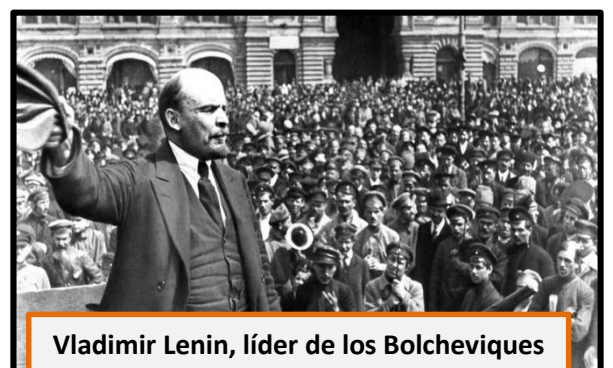
Vladimir Lenin, líder de los Bolcheviques

En cambio, el Imperio Ruso vivió el desarrollo de una revolución inspirada en el marxismo: La Revolución Rusa . En octubre de 1917, el grupo comunista revolucionario, conocido como bolcheviques (cuyo máximo líder era Vladimir Lenin), se tomó el poder en Rusia derrocando al