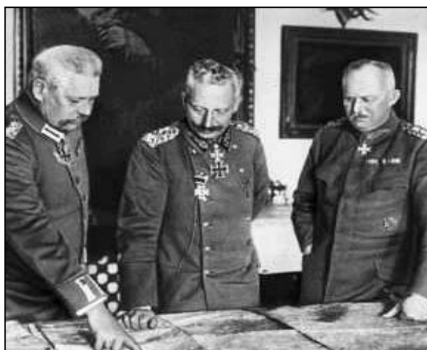
El Gral. Von Hindenburg (izquierda), el Káiser Guillermo II (centro), y el Gral. Ludendorff (derecha) revisan mapas militares en 1918