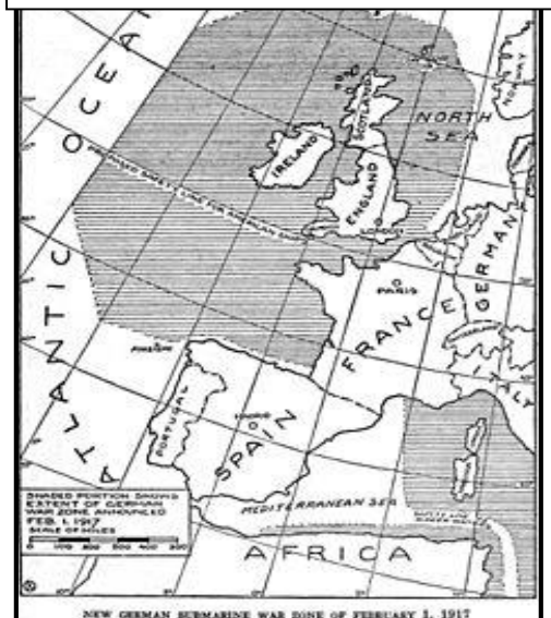
Área de acción de los submarinos alemanes

En paralelo a los incidentes entre Alemania y EE.UU, el Imperio Ruso al mando del Zar Nicolás II comenzaba a vivir una total crisis militar, social y económica, que provocó el estallido de la Revolución Rusa en febrero-marzo de 1917, el fin de la monarquía absolutista de los Romanov (dinastía del Zar Nicolás II) y la formación de débiles gobiernos provisionales. Esta situación era muy preocupante para Inglaterra y Francia, quienes esperaban que los rusos continuaran combatiendo contra los alemanes en el Frente Oriental. Sin embargo, los últimos intentos de generales rusos por mantener la guerra terminaron en fracasos, por falta de armamentos, desabastecimiento y el desorden y desmotivación de los soldados para combatir.